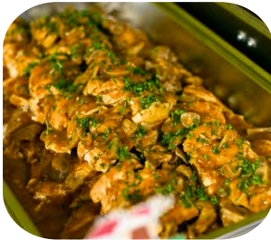
Grilled Chicken Breast with Mushroom Sauce อกไก่ย่างราดซอสเห็ด