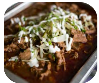
Stroganoff Beef เนื้อสโตรกานอฟแบบรัสเซีย