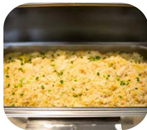
Fried Rice with Chicken ข้าวผัดไก่