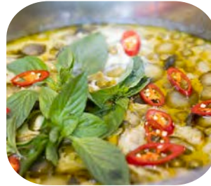
Green Curry with Chicken แกงเขียวหวานไก่