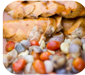
Breast Chicken with Rosemary Sauce อกไก่อบซอสโรสแมรี่