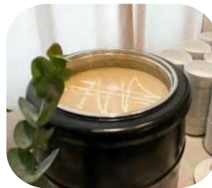
Cream of Mushroom Soup ซูปครีมเห็ดขุ่น