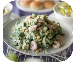
Shrimp and Broccoli Salad with Caesar Dressing กุ้งและบร็อกโคลี่เคล้าน้ำสลัดซีซาร์