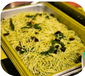
Spaghetti with Pesto Sauce สปาเกตตีซอสเพสโต