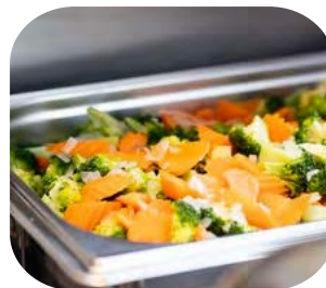
Sauté Broccoli and Carrot บล็อกโคลี่ผัดแครอทผัดเนย