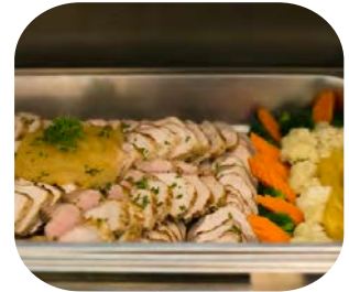
Roasted Pork Loin with Mustard Sauce หมูอบซอสมัสตาร์ด