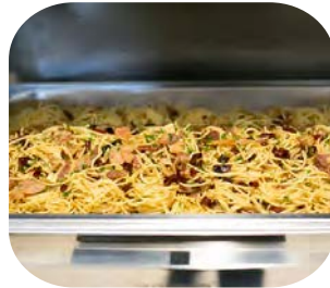
Spaghetti with Bacon and Crispy Chili สปาเกตตีผัดพริกแห้งกับเบคอน