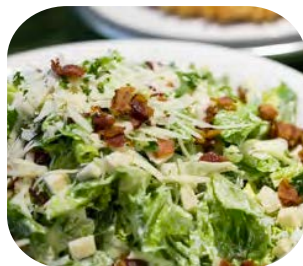
Caesar Salad สลัดซีซาร์