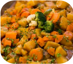
Country style Beef Stew สตูว์เนื้อแบบพื้นบ้านตะวันตก