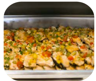
Grilled Salmon with Caper, Fresh Tomato and Olive Oil ปลาแซลมอนย่างซอสเคปเปอร์