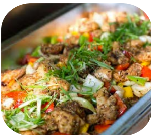
Stir Fried Sea Bass with Black Pepper and Capsicums ปลาทะเลผัดพริกไทยดำ