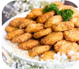
Maryland Style Crab Cake ทอดมันปูแบบอเมริกัน